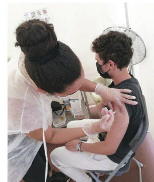
Injection dans un des box dédiés