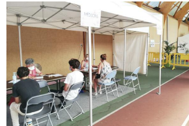
Consultation auprès d'un des médecins