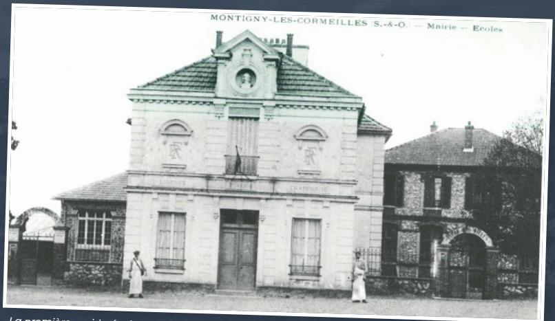
La première mairie-école a été inaugurée en octobre 1883, place de la Mission (place de la Libération), pour remplacer les locaux d'enseignement place de l'Église, trop exigües et vétustes.