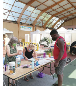
Accueil des visiteurs ayant pris rendez-vous

19h Le centre ferme ses portes, avant de connaître la même effervescence dès 8h30 le lendemain matin.