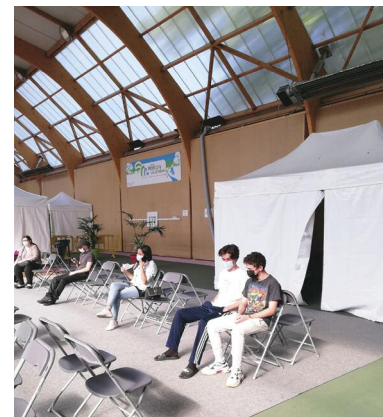
Quinze minutes d'attente minimum après le vaccin