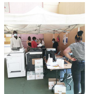
Remise des documents administratifs à chaque patient