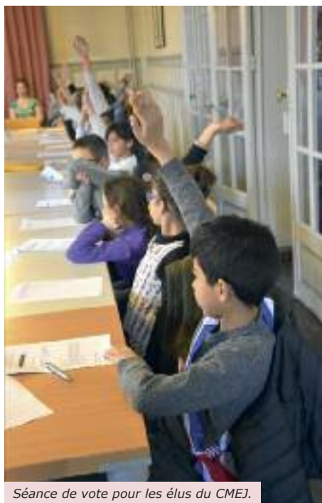
Séance de vote pour les élus du CMEJ.