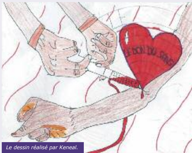
Le dessin réalisé par Keneal.

« Nous aidons car nous sommes fiers de participer à sauver des vies et que nous souhaitons être solidaires avec les donneurs et les receveurs ».