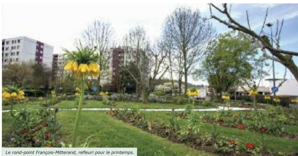
Le rond-point François-Mitterand, refleurit pour le printemps.

Ville verte, Montigny après son prix d'excellence en 2015 au concours Villes et Villages Fleuris, est cette année candidate pour la Première fleur . Loin d'être purement honorifique et de ne concerner que le fleurissement, le label Villes et Villages Fleuris distribue la réponse satisfaisante selon de très nombreux critères relatifs à la qualité de l'environnement et espaces urbains, la préservation des espaces naturels, la cohérence de gestion des espaces verts. L'abandon par la commune de l'utilisation de produits phytosanitaires est ainsi un atout. Tout comme la floraison de milliers de nar-