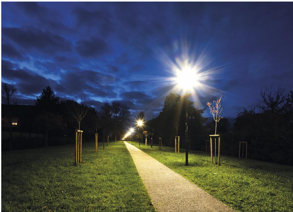
La Promenade des Impressionnistes à la tombée de la nuit.

Face à la hausse des prix de l'énergie, la communauté d'agglomération du Val Parisis a décidé d'éteindre les lumières la nuit depuis le 1 er juillet 2022, en accord avec les 15 communes (dont Montigny) pour lesquelles elle gère désormais l'éclairage public, et d'accélérer le passage au 100% LED.