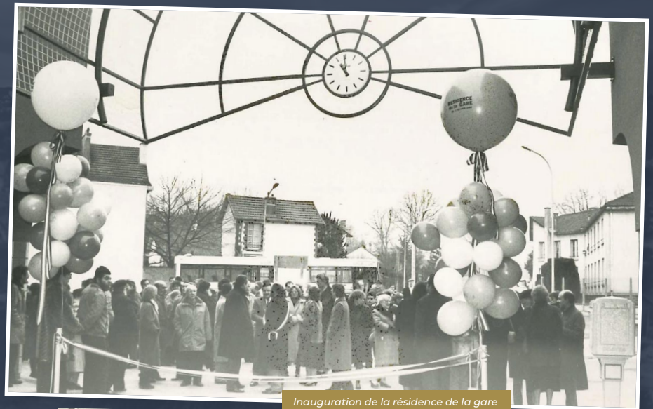
Inauguration de la résidence de la gare en 1987, en présence des élus de la Ville et des habitants du quartier.

Les réalisations de l'opération de la Croix Blanche s'échelonnent de 1989 à 1991 et concernent l'îlot des Grouettes, situé le long de la rue du Général-de-Gaulle, le lotissement des Copistes, en bordure de l'avenue Fernand-Bommelle, l'îlot des Maréoux, entre la rue du Général-de-Gaulle et la rue des Maréoux et enfin l'îlot des Copistes, avenue Fernand-Bommelle.