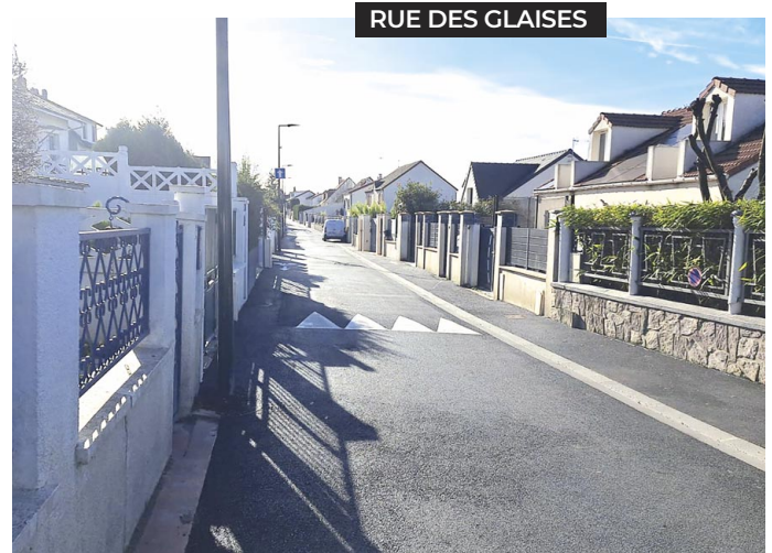
RUE DES GLAISES

Afin d'améliorer la sécurité des cyclistes et de renforcer la place du vélo en ville, de nouveaux aménagements ont été réalisés en janvier. Les rues Albert-Marquet, de la gare, de Saint-Leu et Serge-Launay ont été mises en doubles sens cyclable. La signalisation (via l'installation de panneaux carrés sur fond bleu) des rues déjà en double sens cyclable a été améliorée. Les rues des Bergères, du Panorama, de la Halte, Simone-Veil, Jacques-Verniol, des Glaises, des Cordes et du Général Leclerc. Près d'une trentaine de nouveaux appuis vélos ont également été installés, notamment aux abords des écoles, pour permettre aux cyclistes de stationner leur vélo en toute sécurité. « Et d'ici l'été, deux nouveaux box à vélos seront accessibles sur réservation rue Auguste-Renoir, juste à côté des jardins familiaux » précise Uriell Marquez, conseillère municipale déléguée aux transports et au plan vélo.