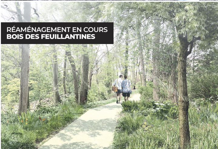
RÉAMÉNAGEMENT EN COURS BOIS DES FEUILLANTINES

Les travaux du bois des Feuillantines ont été officiellement lancés le 10 janvier dernier, en présence du maire Jean-Noël Carpentier et de Hafid labassen, adjoint en charge des travaux, de la propreté des espaces publics et de l'entretien des espaces verts. Cet espace de 6400m 2 , l'équivalent de la Source, sera accessible au public 7 jours sur 7 d'ici au printemps. Le terrassement de l'allée piétonne, en sable stabilisé renforcé, est en cours. Ce cheminement sera éclairé par des LED à basse consommation, éteintes une partie de la nuit comme l'éclairage public de la commune. De nouveaux arbres et arbustes seront également plantés, notamment des arbres fruitiers (pommiers, poiriers, cerisiers...). Trois tables de pique-nique en bois agrémenteront la zone de rencontre et six bancs en béton seront installés, ainsi qu'une signalétique pédagogique pour découvrir la faune et la flore locales. Ce nouveau bois sera accessible depuis le parking des Feuillantines mais aussi par deux entrées distinctes rue de Bellevue, dont une accessible aux personnes à mobilité réduite à proximité du parvis de l'église.