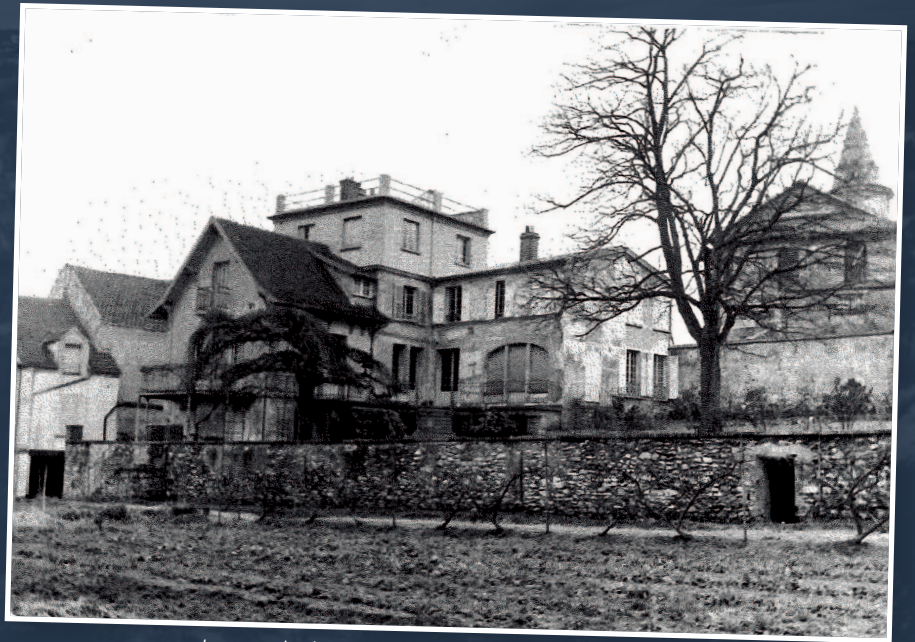
Le verger planté par les sœurs dans le bois des Feuillantines.