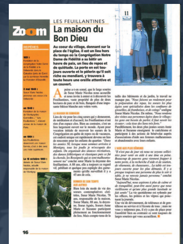
Montigny notre commune d'octobre 1998.