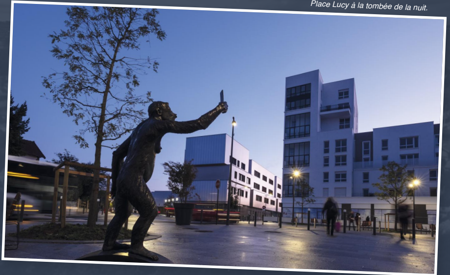
Place Lucy à la tombée de la nuit.

Yves Coppens était un paléontologue et paléoanthropologue, professeur honoraire au Muséum national d'histoire naturelle et au Collège de France. Il était également membre de l'Académie des sciences et de l'Académie de médecine. Décédé le 22 juin 2022, Yves-Coppens est l'auteur de plus d'un millier d'articles et délivres traitant de sa discipline.