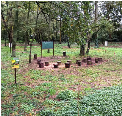
BOIS DES COPISTES

L'entreprise Veolia est intervenue en octobre rue de Conflans, au pied de la passerelle Aimé-Césaire qui surplombe l'A15, pour réparer une fuite d'eau survenue sur une conduite souterraine.