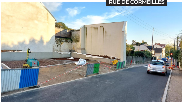
RUE DE CORMEILLES

Idée citoyenne issue du budget participatif 2023-2024, quatre boîtes à graines viennent d'être installées à l'entrée des jardins familiaux (avenue des Francs, parc Launay, rue Auguste-Renoir et rue Lucien Boxstaël). Le principe ? Les jardiniers ont la possibilité de partager leurs graines ou bulbes à d'autres jardiniers. Si vous avez la main verte, n'hésitez pas à vous servir et à apporter à votre tour de nouvelles semences !