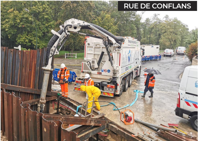
RUE DE CONFLANS

Les travaux de rénovation de la rue de Cormeilles se poursuivent. Les trottoirs seront réalisés lorsque les derniers raccordements seront effectués par les différents intervenants, aux alentours de la fin novembre. Le petit parking situé au n°5 de la rue sera prochainement accessible. A l'angle de la rue de Verdun, le trottoir est en cours d'élargissement et un espace végétal sera aménagé.