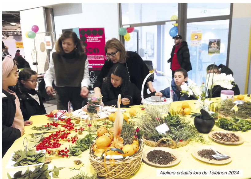
Ateliers créatifs lors du Téléthon 2024

Des animations festives pour la recherche médicale !