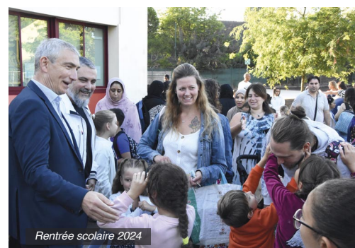
Rentrée scolaire 2024