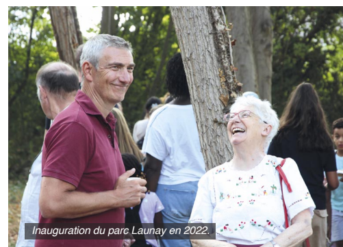
Inauguration du parc Launay en 2022.