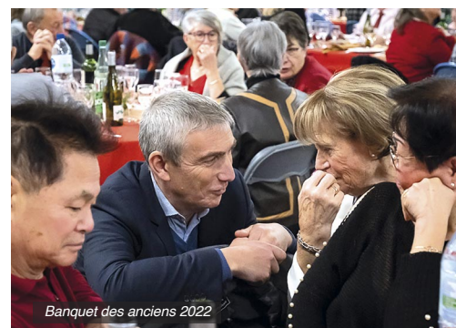
Banquet des anciens 2022