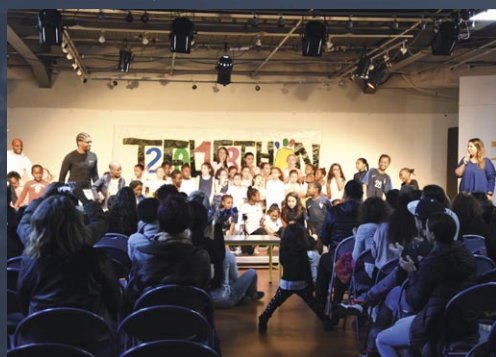
Spectacle de l'enfance en 2018

Comme dans de nombreuses communes françaises, le Téléthon est un moment fort de solidarité autour de la recherche sur les maladies rares. Depuis 2017, la ville se mobilise via des associations (Force T, associations sportives) et des initiatives municipales des différents services pour soutenir l'AFM-Téléthon.