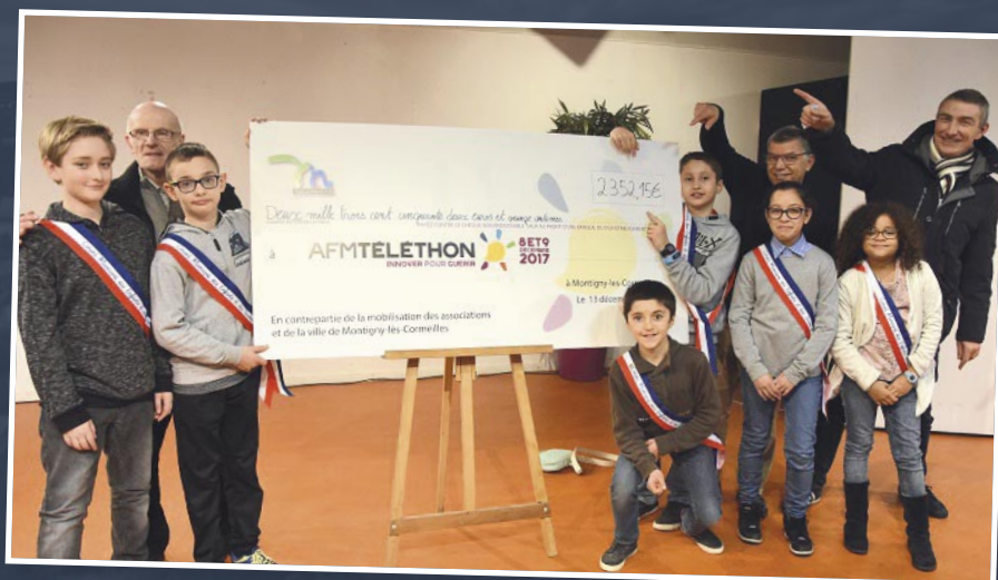
L'édition 2017 avait rapporté 2352,15€ à l'association AFM-Téléthon.

→ Tournois gaming : en 2024, le service municipal de la jeunesse a organisé une soirée gaming (jeux vidéo) à l'Espace Nelson-Mandela, et l'intégralité des recettes était destinée au Téléthon.