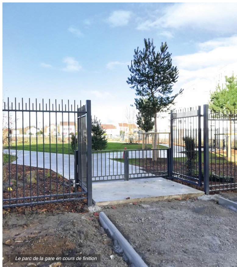
Le parc de la gare en cours de finition