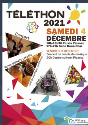
Affiche de l'édition 2021