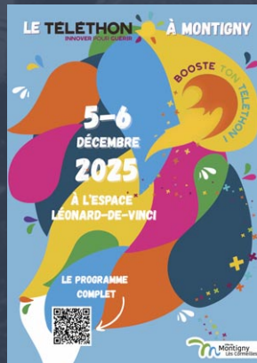
Affiche de l'édition 2025