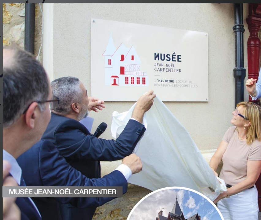
MUSÉE JEAN-NOËL CARPENTIER

Le samedi 30 août, la Ville a inauguré le musée Jean-Noël Carpentier, un équipement retraçant l'histoire sociale et urbaine de la ville.