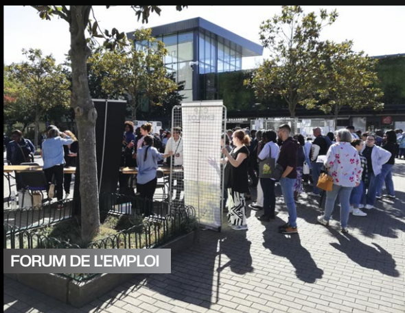
FORUM DE L'EMPLOI

Près de 150 visiteurs se sont rendus sur le stand de la Ville lors du marché de l'emploi sur le parvis Picasso, aux côtés d'une trentaine d'exposants.