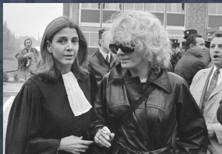
Gisèle Halimi à gauche avec l'actrice Delphine Seyrig.

Avocate engagée, elle consacre sa vie pour défendre celle des autres. Retour en quelques lignes sur le parcours de cette figure pionnière du droit des femmes et justicière pour l'évolution de l'opinion publique française.