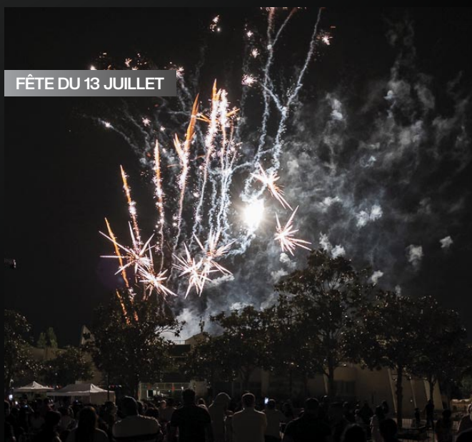
FÊTE DU 13 JUILLET

Plus d'une centaine d'habitants se sont retrouvés au village pour participer à la soirée loto organisée à l'occasion des animations estivales.