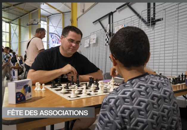
FÊTE DES ASSOCIATIONS