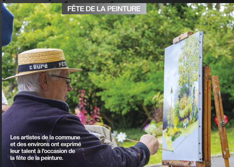
FÊTE DE LA PEINTURE

Le Centre culturel Picasso a eu le plaisir de recevoir Louis Chedid pour un concert qui a rassemblé plus de 250 spectateurs.