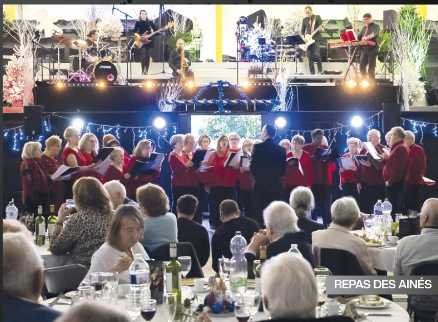
REPAS DES AINÉS

Près de 400 personnes ont partagé le banquet des anciens à l'occasion des fêtes de fin d'année.