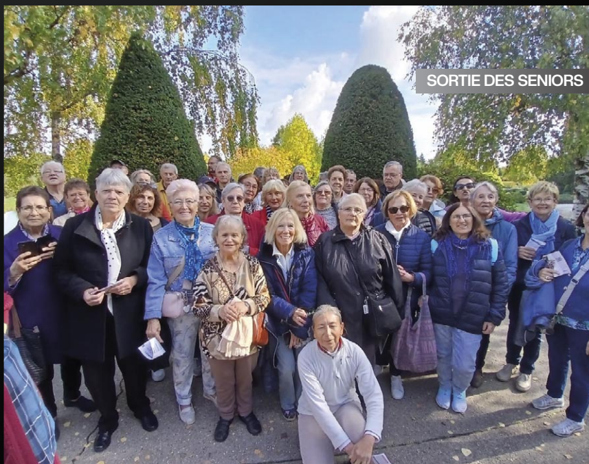
SORTIE DES SENIORS

Un groupe de seniors a profité d'une agréable journée de sortie à France Miniature. Cette visite leur a permis de découvrir les plus beaux monuments et régions de France en version miniature, dans un cadre verdoyant et convivial.