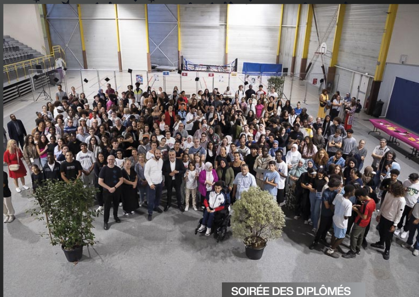
SOIRÉE DES DIPLÔMÉS

L'édition 2025 de la soirée des diplômés a réuni plus de 300 participants, célébrant tous les certifiés ignymontains, du brevet des collèges au baccalauréat.