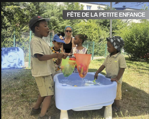
FÊTE DE LA PETITE ENFANCE

Château gonflable, maquillage, barbe à papa... Les petits Ignymontains et leurs parents ont profité des animations installées à l'occasion de la fête de la petite enfance.