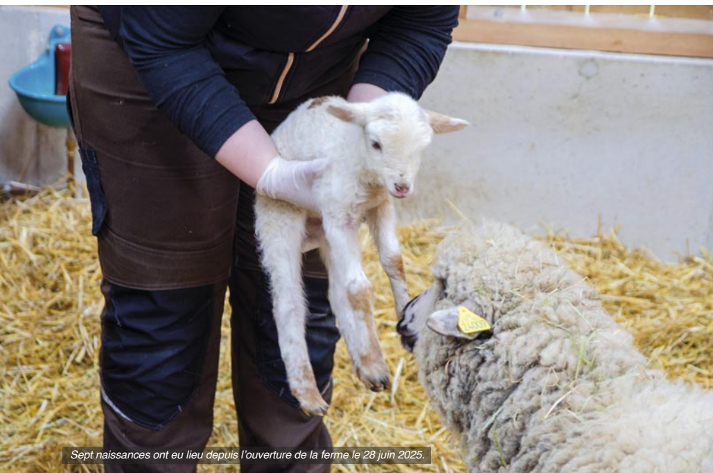
Sept naissances ont eu lieu depuis l'ouverture de la ferme le 28 juin 2023.