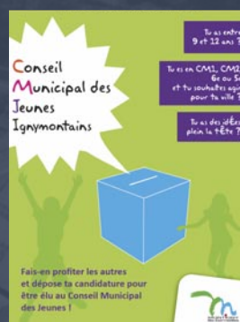
Première édition du CMEJ - 2015