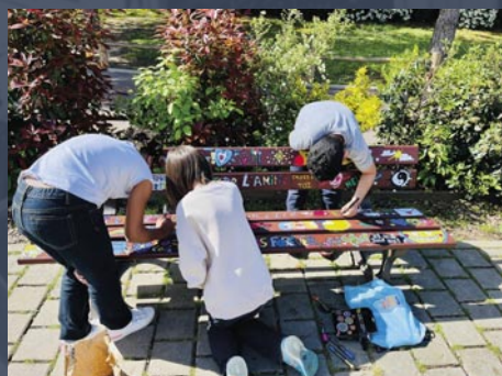
Banc de l'amitié

Leurs missions principales ? Participer activement aux différents projets menés par l'équipe municipale, qui sont leurs collègues, trouver des idées afin d'améliorer le cadre de vie des ignymontains et ignymontaines et concrétiser des réalisations votées à Montigny. Les jeunes élus du CMEJ apprennent, au cours de leur mandat de deux ans, la citoyenneté de manière ludique, mais également l'investissement sur des projets à long terme. Le mandat d'élu leur permet de s'engager autour de trois grands thèmes principaux et trois commissions dédiées : « environnement et citoyenneté », « loisirs », et « solidarité, vivre ensemble ». Lors des précédents mandats, ils ont contribué à l'éclosion de plusieurs projets comme les bancs de l'amitié, l'exposition « les animaux en voie de disparition », le projet d'espace zen aux abords des écoles. Ils participent également à l'ensemble des cérémonies officielles et aux événements annuels de la commune comme le téléthon, la fête des enfants et la marche contre les violences faites aux femmes. Les mandats sont aussi marqués par des événements forts comme la visite de l'assemblée nationale, les rencontres avec les acteurs locaux et la prise de parole lors des cérémonies commémoratives.