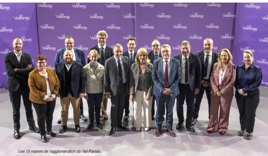
Les 15 maires de l'agglomération du Val-Paris.