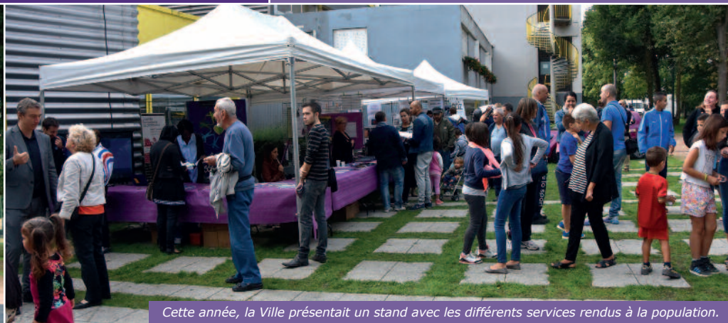
Cette année, la Ville présentait un stand avec les différents services rendus à la population.