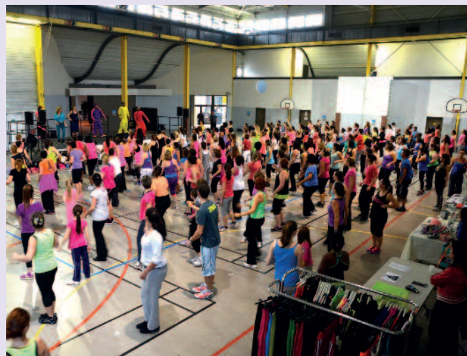
C'est la troisième fois que la ville accueille l'action caritative de l'association Rêves.

L'association Rêves organise, le samedi 10 octobre prochain, des séances de zumba, espace Léonard-de-Vinci. Ainsi, à travers un pur moment de plaisir, de partage et de solidarité, et pour seulement 20 €, deux sessions données par des instructeurs bénévoles sont proposées aux participants. L'association Rêves, créée en 1994, a pour principale mission de réaliser les rêves d'enfants atteints d'une grave maladie. Grâce à Zumba de Rêves, 17 400 euros ont déjà été récoltés, soit 17 rêves d'enfants malades réalisés ! Inscriptions sur place. Dimanche 10 octobre Zumbathon - Espace Léonard de Vinci, de 14h à 17h. Rue Auguste-Renoir.