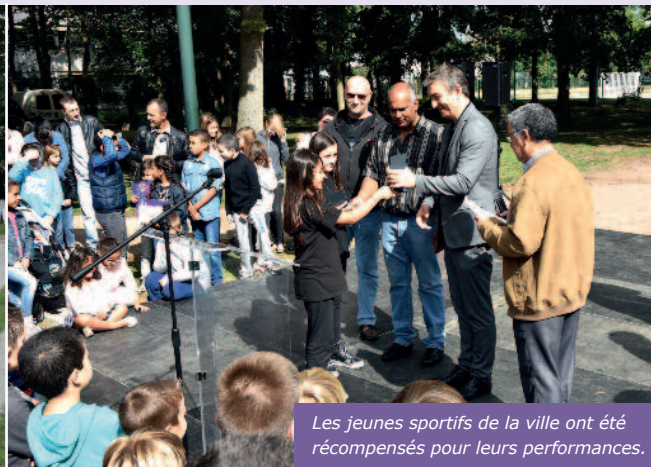
Les jeunes sportifs de la ville ont été récompensés pour leurs performances.