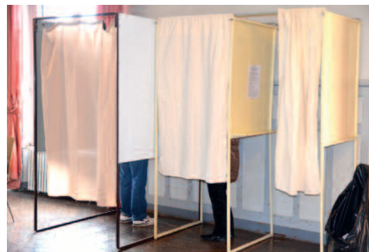
Les élections des jeunes conseillers municipaux se feront comme celles des grands : passage dans l'isoloir et... a voté !

candidat, il suffit d'être Ignymontain et d'avoir entre 9 et 12 ans. La semaine précédant les vacances d'automne, les services Jeunesse et Education passeront dans les classes pour présenter les missions de ce conseil municipal version jeunes et distribuera à chaque élève un dossier de candidature à remettre après les vacances au service jeunesse. Le premier conseil municipal des jeunes se tiendra en novembre dans le cadre de la journée des droits de l'enfant.