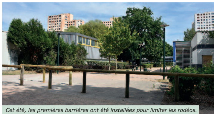
Cet été, les premières barrières ont été installées pour limiter les rodéos.

Depuis plusieurs mois, des rodéos de deux-roues perturbent la tranquillité de la commune. Quads, motos et scooters provoquent insécurité et exaspération des habitants. Face à ces incivilités, la ville a organisé des réunions avec les services de police, les bailleurs pour endiguer le phénomène. Et ce travail partenarial est payant. Cet été, on a pu dénombrer pas moins de 13* interventions suite à des appels au « 17 », 5 véhicules deux-roues mis en fourrière, 6 procédures établies à l'encontre de personnes en infraction, 4 contrôles routiers, 7 contrôles des parties communes des immeubles et 85 heures de patrouilles pédestres. Lors de la table ronde du 24 septembre, en présence du délégué interministériel à la sécurité routière et du Préfet, Jean Noel Carpentier a rappelé que les rodéos constituent une véritable problématique et que le maintien de la sécurité impose des actions plus volontaires de l'Etat. Contact : 01 30 26 35 50 Source : Direction départementale de la Sécurité.