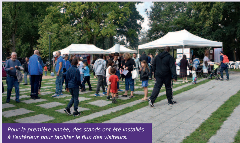
Pour la première année, des stands ont été installés à l'extérieur pour faciliter le flux des visiteurs.

Au travers d'échanges avec les bénévoles, de démonstrations et de spectacles, cette manifestation a donné aux habitants la possibilité de découvrir la multitude d'activités socioculturelles et sportives proposées dans la commune.