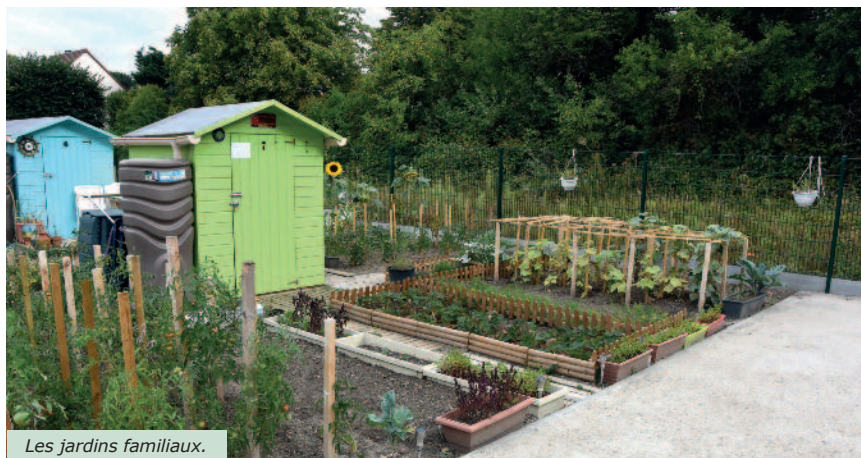
Les jardins familiaux.

Pour aider les jardiniers, le service des espaces verts fera livrer du compost en partenariat avec le syndicat Emeraude. Quant à la réalisation de nouveaux jardins, la ville travaille à l'acquisition de terrains supplémentaires pour ainsi atteindre l'objectif des 150 jardins familiaux d'ici la fin du mandat.