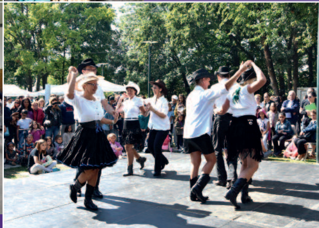
Démonstrations de danse country avec l'association Les Talons Noirs.