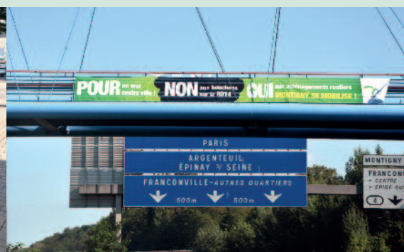
De nombreux élus sont allés à la rencontre des habitants pour faire signer la pétition - Au total 10 banderoles ont été apposées sur les ponts au-dessus de l'A15 et dans la ville.