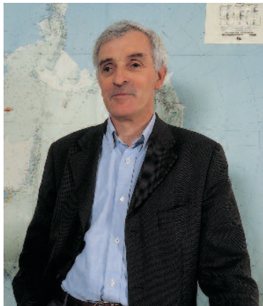
Jean Jouzel, climatologue de renom et prix Nobel de la paix 2007.

Dans le cadre de la préparation de la COP 21, le député-maire propose un débat le samedi 10 octobre 2015 à 15h, au centre culturel Picasso. Pour contribuer aux échanges, Jean Jouzel, l'un des plus éminents climatologues, sera présent. Deux questions à Jean Jouzel :