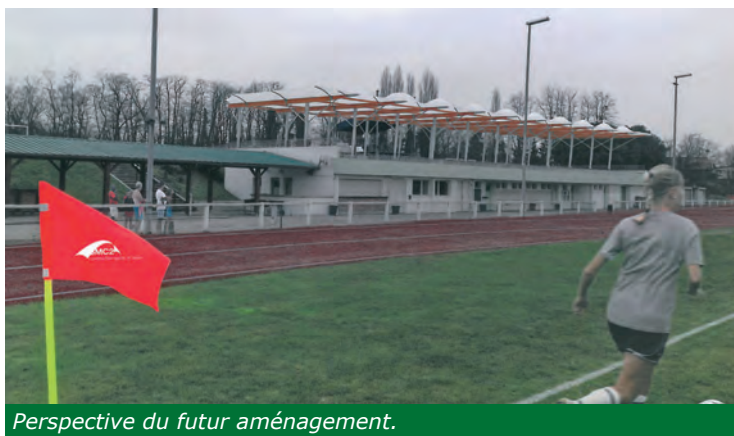
Perspective du futur aménagement.

Dur d'apprécier les entrainements de football le mercredi après-midi lorsqu'il pleut ou qu'il vente... cela sera bientôt chose possible !