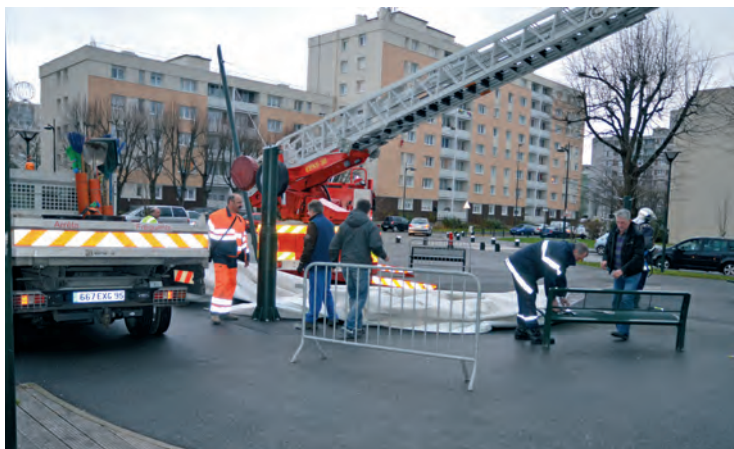
L'intervention conjointe des pompiers et des services techniques pour détacher la toile tendue de la place Greuze arrachée à un angle suite aux vents forts de décembre dernier.

365 nuits par an, l'équipe d'astreinte de la commune ne dort que d'un œil. L'agent des services techniques, le cadre et l'élue qui la constituent sont prêts à agir à chaque instant pour assurer, quoi qu'il arrive, la sécurité des habitants et des équipements communaux.