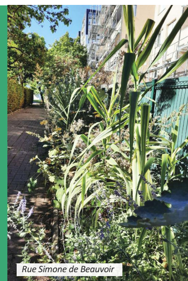
Rue Simone de Beauvoir