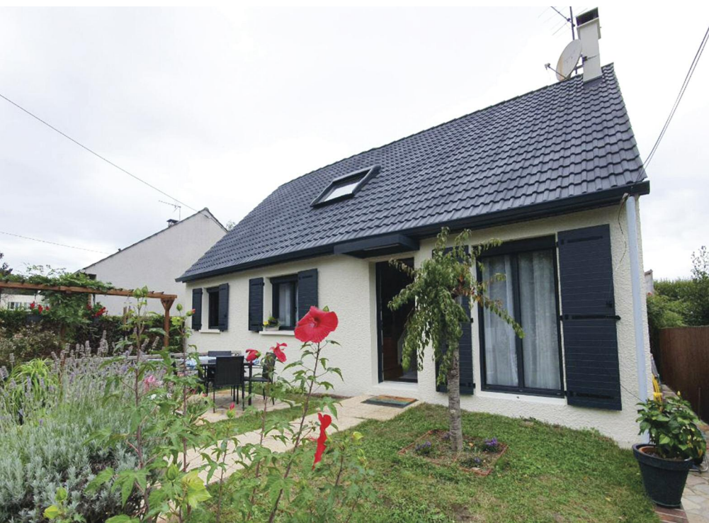
Avec l'aide financière de la commune, Mme Degnieau a rénové la façade de sa maison.

Près d'une trentaine de propriétaires de maison individuelle ont déjà bénéficié de l'aide au ravalement de façade, mise en place par la municipalité en mai dernier.