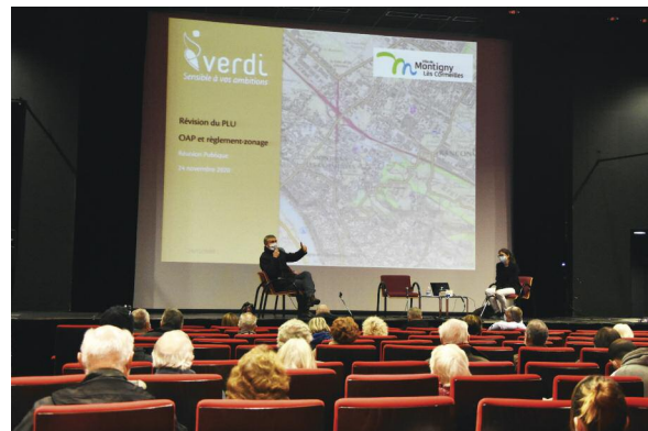
Deux réunions publiques ont été organisées, les 24 et 25 novembre, dans le respect du protocole sanitaire.

N'hésitez pas à consulter le site de la Ville ( montigny95.fr , rubrique « en un clic », révision du PLU), le dossier de révision du PLU disponible au centre technique municipal aux horaires d'ouvertes ainsi que le registre de concertation également à votre disposition. Vous pouvez aussi adresser vos questions par e-mail : urbanisme@ville-montigny95.fr