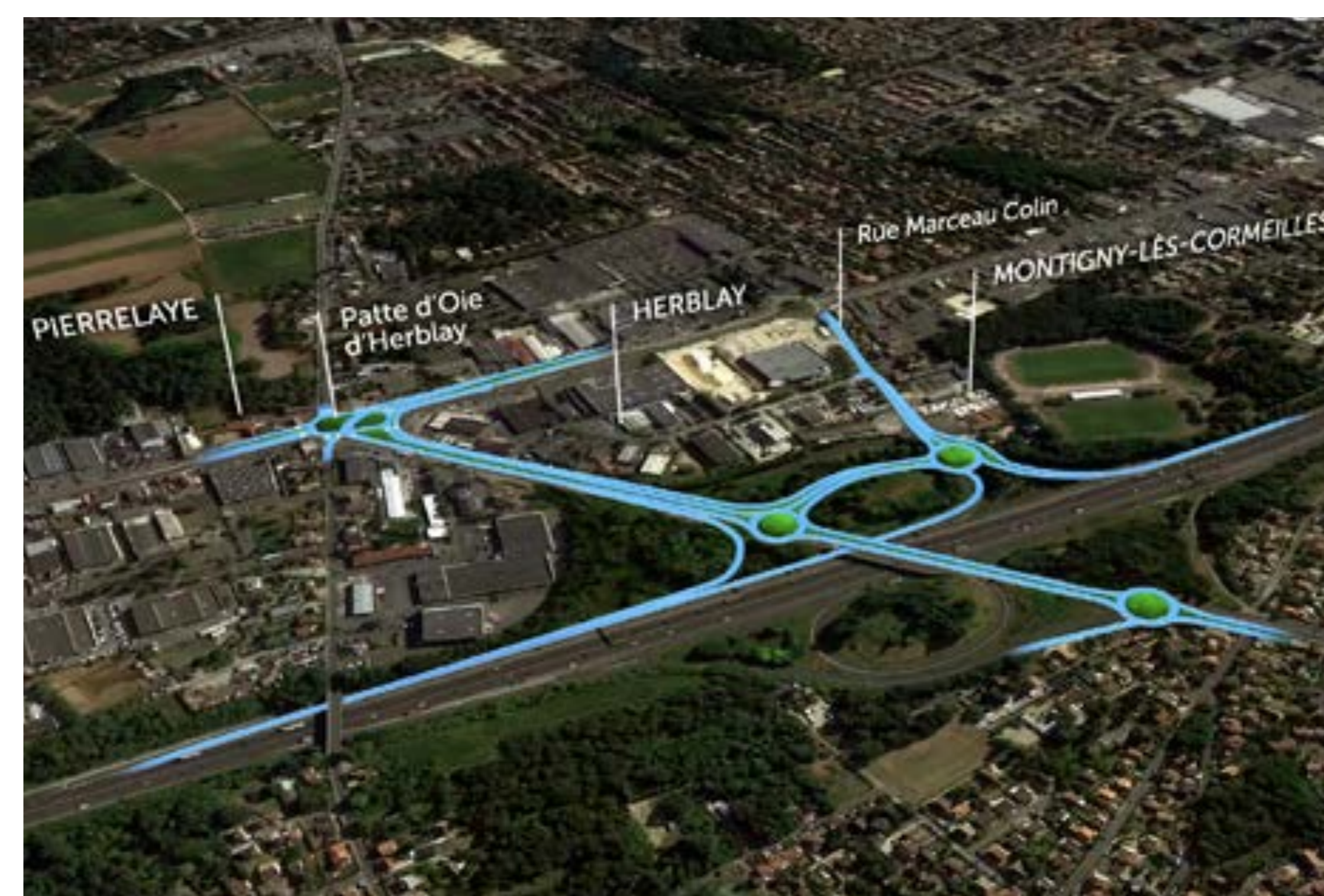
Tracés de la création de la bretelle, des giratoires et de la Patte d'Oie d'Herblay